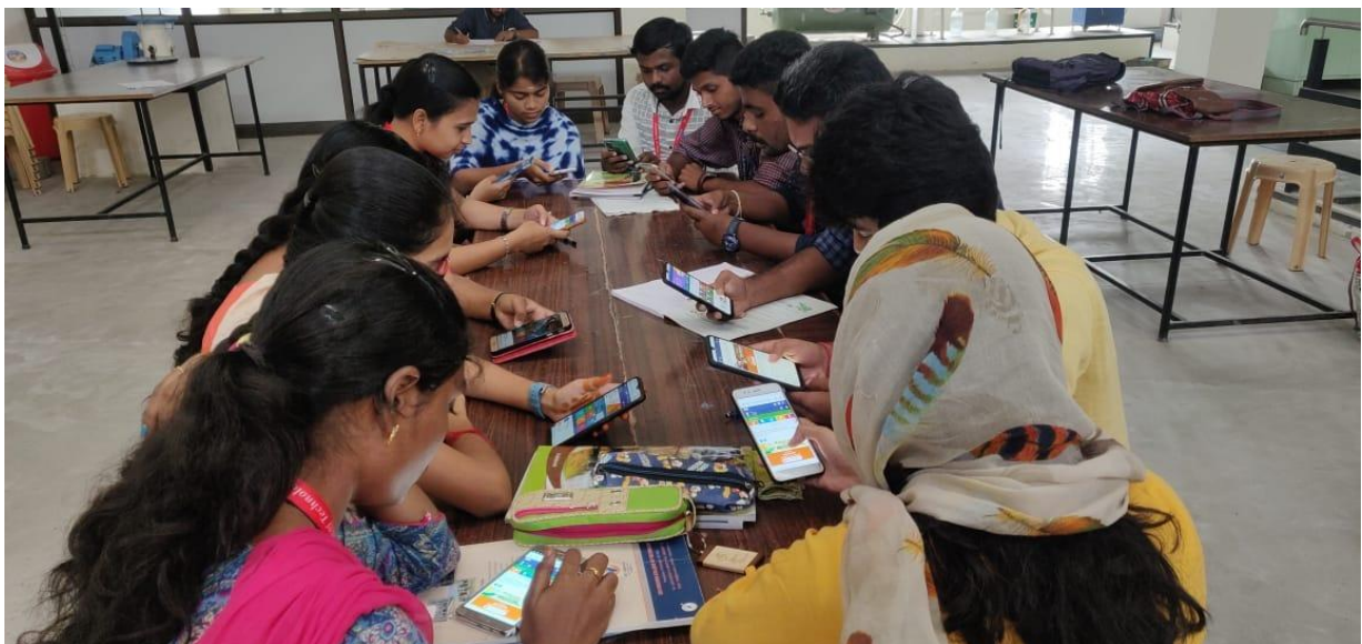
Paragraph Writing Contest on Ideas on Constructive works of Mahatma Gandhi - Topic : Non-violence: the strongest tool for constructive change